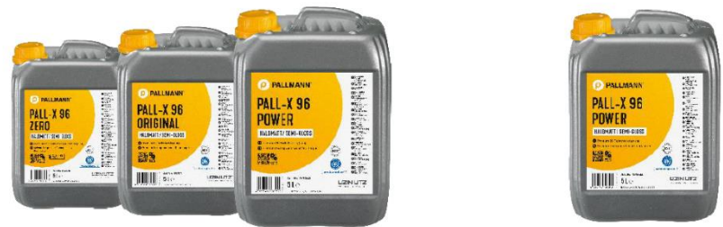
Volle Power aufs Parkett mit den PALL-X 96 Versiegelungen.